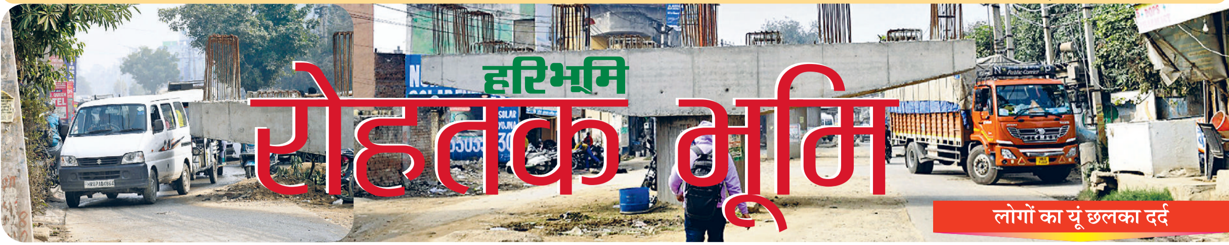
लोगों का यूँ छलका दर्द