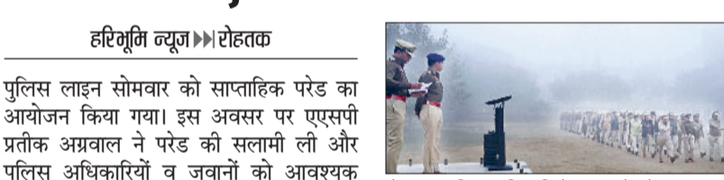
हरिभूमि न्यूज | रोहताक