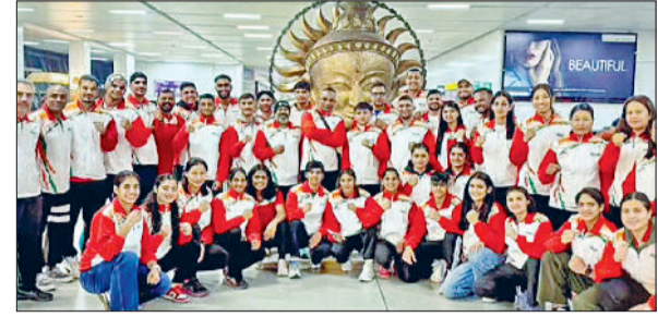
रोहताक। बोस्को कप अंतरराष्ट्रीय बाक्सिंग प्रतियोगिता में चयनित खिलाड़ी।